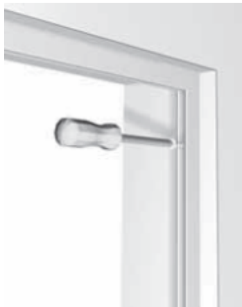
5 - Posizionare ed avvitare il telaio con un cacciavite