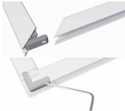
2 - Inserire le squadrette e avvitare con un chiavino