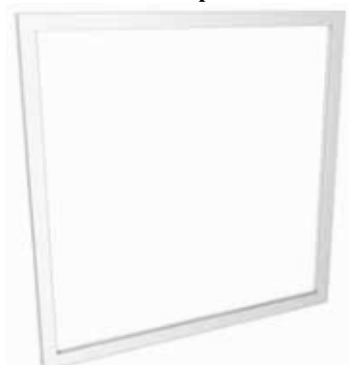
3 - Profilo telaio assemblato