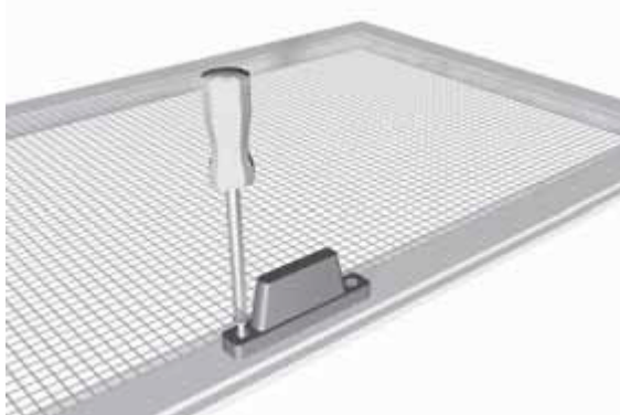
7 - Fissare le maniglie (Le forniamo già montate)