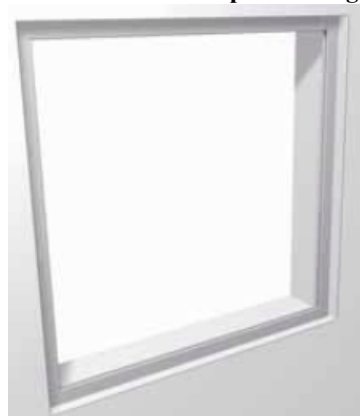
6 - Telaio montato