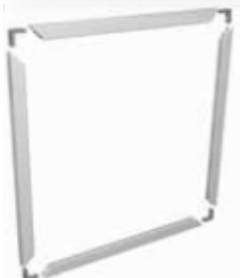
1 - Individuare il profilo telaio e le squadrette