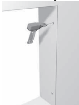
4 - Effettuare i fori per il fissaggio del telaio